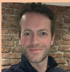
Wouter GMR-lid en leerkracht (5A/6B)